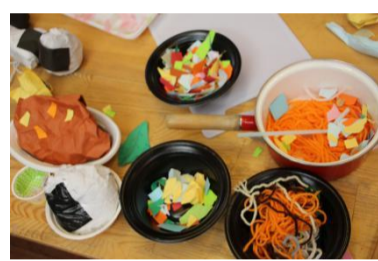
このメニューもほんの一部である

シェフや料理人が「まだまだ作るんだ」とばかりに腕を振るっている。ただ作るというわけではなく、「おいしそうに作る」、「食べたくなるように作る」ということが肝なのだそう。時々味見をしながら忙しく働いている。「社長、これどうしますか?」「ああ、それね」社長と助手のコミュニケーションもばっちりの様子である。この「もりのれすとらん」では特別にお米の大切さを助手と共に確認し、米を使う料理には時間も手間もかけて料理しているとのこと。そのため、是非に出かけて食べてみたいもの思っている。 そして、記者は目撃した。鍋から大胆に試食を繰り返している料理人の姿を。話を聞いてみると、「もりのれすとらん」にとって、とても大事な試食であるそうだ。こうして、食べに来て下さるお客さま満足のための飽くなき探究心を持って取り組んでいるのである。