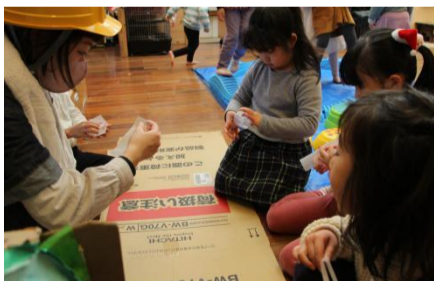
「道」を作る作業員たちは真剣だ

「もりのれすとらん」のイトインコーナーでは、お客たちが宴会を開いていた。美味しそうな食事を前に話に華を咲かせていた。また、「もりのれすとらん」の片隅で、小さなやきいもやさんが開店していた。またこのやきいもが評判を呼び、たくさんのお客でごった返していた。やきいも店の店員さんに話を聞くと、「おいしいの」と語る。安納いもを使っているとのこと、今後開店されることを期待している。