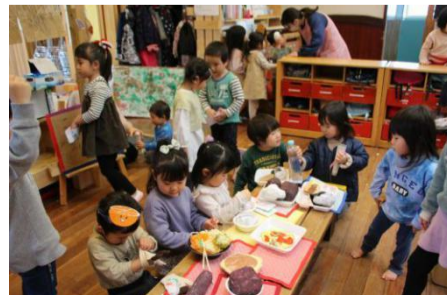
会場はにぎやかに、笑い声が溢れていた