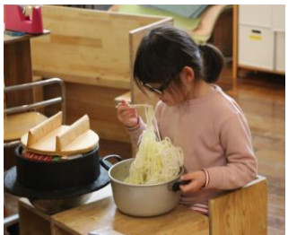
助手も試食から味の追及をする

パーティーの日もほど近いこの頃、会場となるあいの保育園ホールでは、とてもおいしそうなのがたくさん並ぶようになった。あちらこちらで大きな鍋やフライパンを動かしている音が響いてくる。音と共に熱気が伝わる。