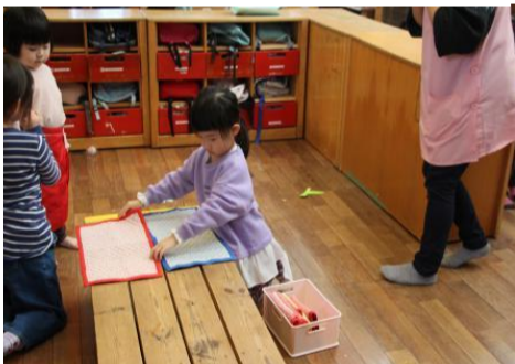
写真下; せっせとテーブルセッティングに勤む「もりのれすとらん」店員

クリスマス前のある日、先日あいで行われたパーティーが引き続き開催され、再び「もりのれすとらん」が開店し、大賑わいの様子を見せていた。様々な種類のおにぎりにラーメン、焼きそばなどの麺類、美味しそうなアイスクリームまである。記者が取材をしている最中にもたくさん注文が入り、お店の中では「はいー、ラーメン一丁あがりー」「アイスクリーム注文はいましたー」など店員の声が乱れ飛んでいた。この混雑状況は開店から閉店まで続き、店員はうれしい悲鳴を上げていた。