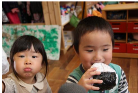
記者がマイクを向けると「美味しいですよ、食べますか」とおにぎりを差し出してくれた

また、開店前には、テーブルのセッティングなどを丁寧に行う店員の姿も見られた。ランチョンマットを綺麗に広げ、お客が座る位置に丁寧に並べていく。「もりのれすとらん」の店員の意識の高さもお判りになるだろう。