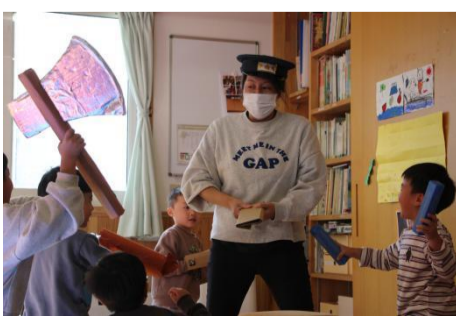
海賊たちを捕まえようとするが...