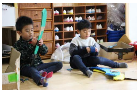
休戦中に剣の手入れをする海賊たち

海賊たちは一時休戦中のご様子。この間に入念に剣の手入れに励んでいた。あいのパーティーは終了したが、あいの住民による活動はまだ続いていく。