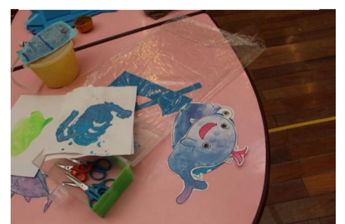
お魚が元気に泳げる海環境を守ろう

海では、海の底の魚づくりたちが、たくさんたくさんお魚を作っている様子があつた。無心でたくさんつくり、海の環境を守っているのだという。こうした取り組みによって、私たち一人一人の意識を呼び起こしながら自然環境を守って行きたいものである。