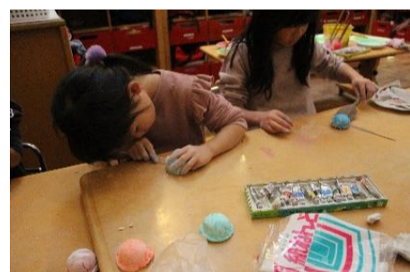
パティシエールたち

さて、こちらはパティシエールたちのよう、アイスクリームづくりに精を出している。あの大手のアイスクリームメーカーには負けていけないという勢いである。みよ、この集中力。きれいな形、色のおいしそうなおアイスクリームをとことん追及している。