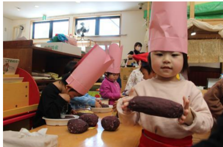
「みて、おおいでしょ？」