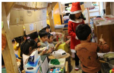
写真上; もりのれすとらんでは店員がそれぞれ役割に分かれて仕事を行っていた。

クリスマス前のある日、先日あいで行われたパーティーが引き続き開催され、再び「もりのれすとらん」が開店し、大賑わいの様子を見せていた。様々な種類のおにぎりにラーメン、焼きそばなどの麺類、美味しそうなアイスクリームまである。記者が取材をしている最中にもたくさん注文が入り、お店の中では「はいー、ラーメン一丁あがりー」「アイスクリーム注文はいましたー」など店員の声が乱れ飛んでいた。この混雑状況は開店から閉店まで続き、店員はうれしい悲鳴を上げていた。