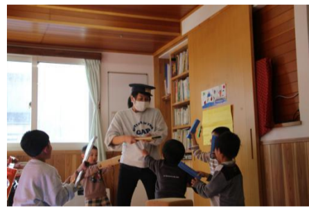
海賊たちに囲まれる会場保安庁員

とはいえ、まだ会場保安庁職員との戦いは終わらない。一瞬、海賊の何人かを捕まえたと思われる場面もあったのだが、すると逃げられてしまった。会場保安庁と、海賊たちの戦いもまだまだ、続いていきそうである。パーティー会場では、海賊の出現にご注意を。