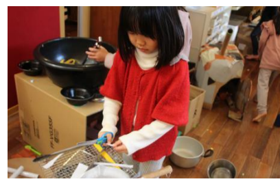
社長自ら研究している

シェフや料理人が「まだまだ作るんだ」とばかりに腕を振るっている。ただ作るというわけではなく、「おいしそうに作る」、「食べたくなるように作る」ということが肝なのだそう。時々味見をしながら忙しく働いている。「社長、これどうしますか?」「ああ、それね」社長と助手のコミュニケーションもばっちりの様子である。この「もりのれすとらん」では特別にお米の大切さを助手と共に確認し、米を使う料理には時間も手間もかけて料理しているとのこと。そのため、是非に出かけて食べてみたいもの思っている。 そして、記者は目撃した。鍋から大胆に試食を繰り返している料理人の姿を。話を聞いてみると、「もりのれすとらん」にとって、とても大事な試食であるそうだ。こうして、食べに来て下さるお客さま満足のための飽くなき探究心を持って取り組んでいるのである。