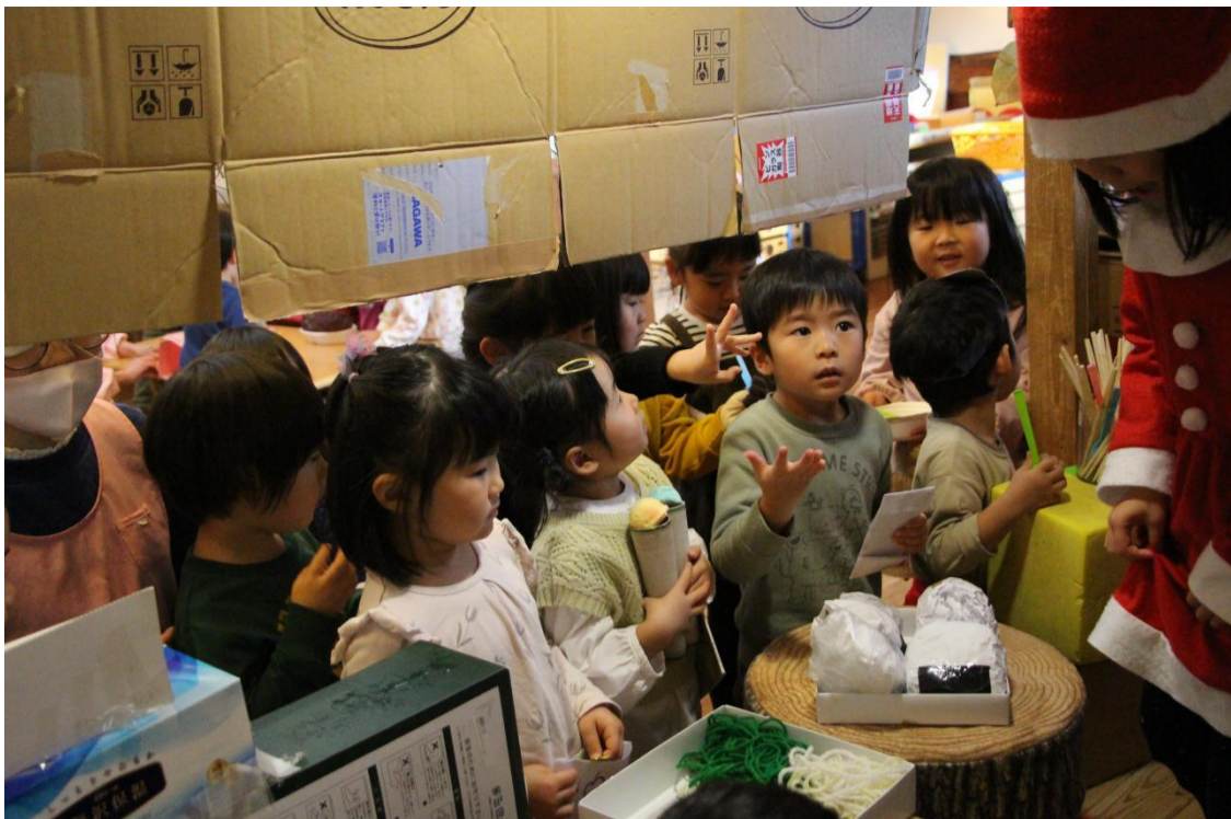
写真; 「もりのれすとらん」にぞくぞくと注文に訪れるお客たち。「おにぎりくださいーい！」